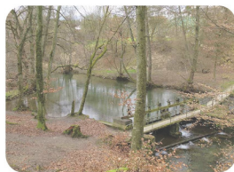
Industriellen Zeitzeugen am Aabach