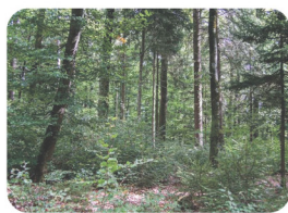
Naturschutzgebiet in der Gemeinde Seon