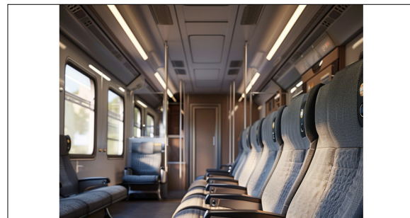
Partielle Bildgenerierung in Photoshop mit der Adobe Firefly Technologie Eigene Darstellung

Generiertes Bild aus Midjourney mit der Aufforderung, faltbare Sitze in einem Zuginnenraum darzustellen Eigene Darstellung