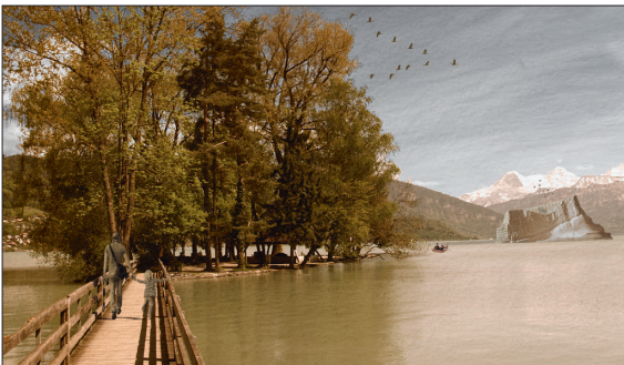
Blick auf den Thunersee: Der Eisberg und die sich darin befindende Halle mit exotischen Pflanzen symbolisieren die Gefährdung der Natur durch den Menschen

Lösung: Damit dies den Besucherinnen und Besuchern durch Narration vermittelt werden kann, werden entlang des Weges Platten installiert, welche mit Inschriften versehen sind. Diese weisen auf bestimmte Ausblicke hin oder sind mit punktuellen Toninstallationen versehen, welche durch Richtlautsprecher in einem Umkreis von 2 m zu hören sind. Der Erlebnispfad verbindet verschiedene Ausstellungsorte, welche Themen wie Ökologie, Geschichte, alternative Energien usw. aufgreifen. Bei der Leuchtturminszenierung, die ein weiterer Ausstellungsstandort ist, wurde die Bedrohung der Natur thematisiert: ein «Eisberg», in dem sich tropische Bäume befinden - zwei Symbole, die auf die Gefährdung der Natur hinweisen. Das Verkehrskonzept ist ganz auf den öffentlichen Verkehr ausgerichtet, und der stillgelegte Bahnhof in Gwatt soll wieder in Betrieb genommen werden.