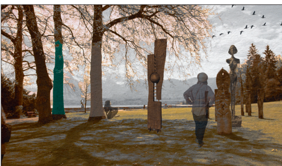
Die Kunstausstellung zur Weisheit der Natur im Schadaupark