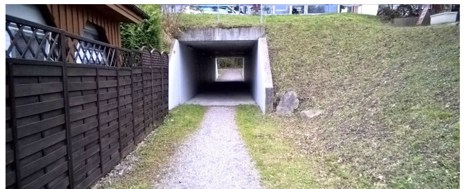
Schwachstelle bei der Unterführung des Hauptzolls: Die Unterführung ist zu schmal und nicht beleuchtet. Die Belagsübergänge sind beim Ein- und Ausgang problematisch.