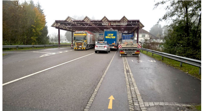
Schwachstelle beim Hauptzoll: wartende LKW versperren die Velo-Verbindung

Das vorliegende Beispiel zeigt, dass für grenzübergreifende Planungen neben einer breit abgestützten Initiative auch eine enge Abstimmung unter den betroffenen Akteuren eine zentrale Voraussetzung ist. Für die beiden Grenzübergänge wurden verschiedene Massnahmen entwickelt, die in das nächste Strassenbauprogramm aufgenommen werden sollen.