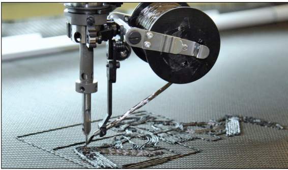
TFP-Prozess Dr.-Ing. Axel Spickenheuer, Dissertation, IPF/TU Dresden