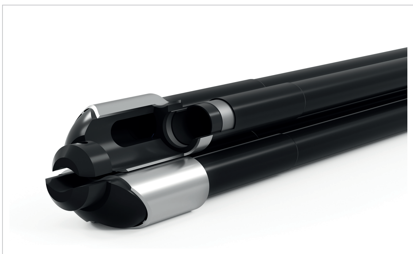
1 | Schnittdarstellung der Sonde

Entwicklung eines hochfesten Kunststoff-Rohrsystems für vertikale Geothermie-Sonden