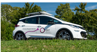
Aussenansicht Wireless Research Vehicle (Opel Ampera-e)