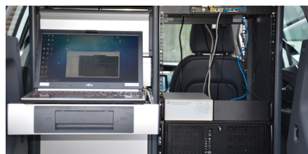
Laborarbeitsplatz im Kofferraum