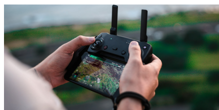
Feldversuche für Forschung und Entwicklung