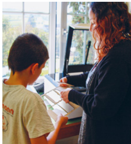
Der Lasercutter schneidet die einzelnen Holzelemente aus.