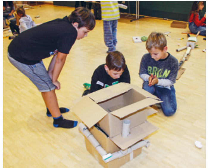
Am Making-Event in der Mehrzweckhalle in Erlen gestalten die Kinder in Gruppen unterschiedliche Kugelbahnen aus Karton.