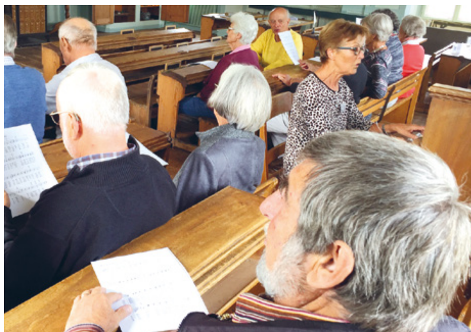
Die Mitglieder geniessen Musikunterricht wie anno dazumal im Schulmuseum Thurgau.