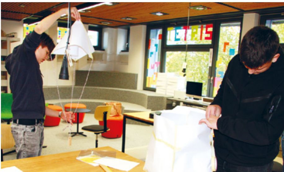
Jede Gruppe hat eigene Ideen, wie sie ihren Fallschirm umsetzen möchte.