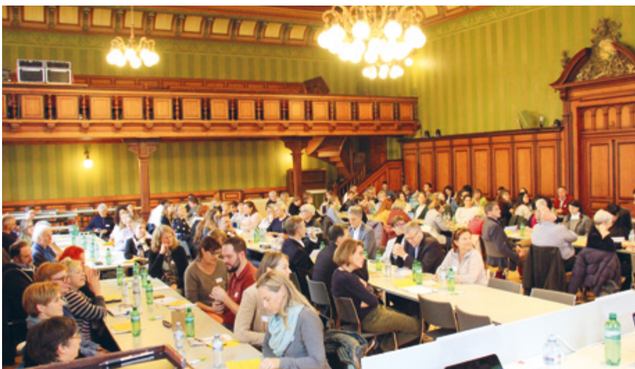
Zahlreiche Gäste und 87 Delegierte trafen sich an der Versammlung von Bildung Thurgau.

Dass die Schule immer mehr gesellschaftliche und familiäre Aufgaben übernimmt, ist offensichtlich. Nun ist die Gesellschaft zunehmend heterogen und individualisiert – mit allen Vor- und Nachteilen. Daraus ergeben sich grosse Chancenun-