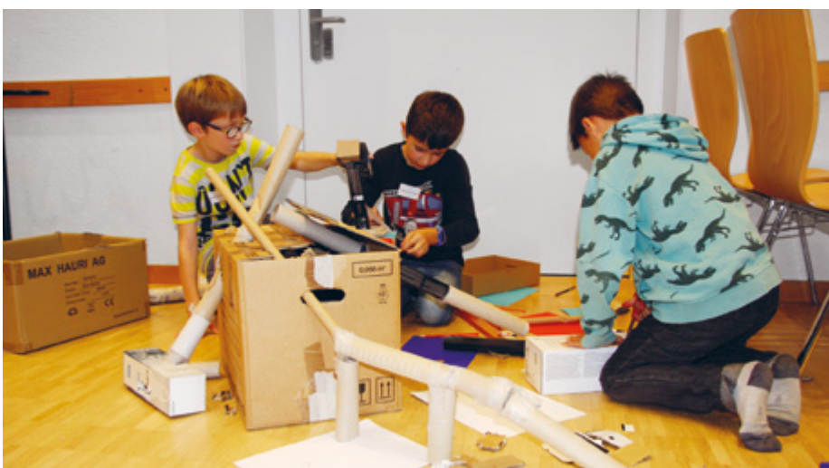
Die Schüler lernen, wie sie ihre Kugelbahn konstruieren müssen, damit die Kugel zum Ziel rollt.