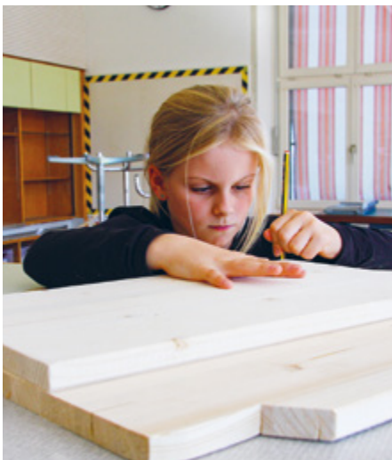
Motiviert arbeiten die Kinder an ihren Werken.