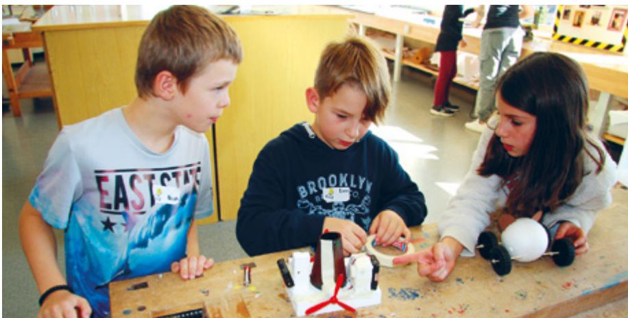
Die Schülerinnen und Schüler diskutieren ihre Ideen und begutachten entstandene Produkte.

Zu Beginn musste ein geeigneter Ort gefunden werden. Da die VSG Nollen zu vier politischen Gemeinden gehört, stellte sich die Frage, wo der MakerSpace eröffnet werden sollte. «Wir wollten einen Standort, der dezentral gelegen ist. Das ehemalige Schulhaus in Buhwil stand damals leer», erzählt Orkun Simsek. Die Räume wurden neu gestaltet. Es gibt jetzt einen grosszügigen Werkraum sowie einen staubfreien Raum in der oberen Etage. Dort werden auch digitale Technologien und Produktionsverfahren angeboten. Die Schülerinnen und Schüler haben einen Greenscreen, 3D-Drucker, Plotter, Thermocutter sowie Lasercutter zur Verfügung. Für den Werkraum konnten die alten Werkbänke übernommen werden. Die meisten Maschinen – wie Säge- und Schleifmaschinen, Bohrer sowie Lötgeräte – hat die VSG Nollen neu erworben. Neben Materialien wie Karton, Kunststoff oder Holz können die Kinder auch Micro Controller, Minicomputer, Sensoren, Aktoren oder Propeller in ihre Produkte einbauen. «Einzig die Metallbearbeitung können wir nicht anbieten», so Nadine Dubach.