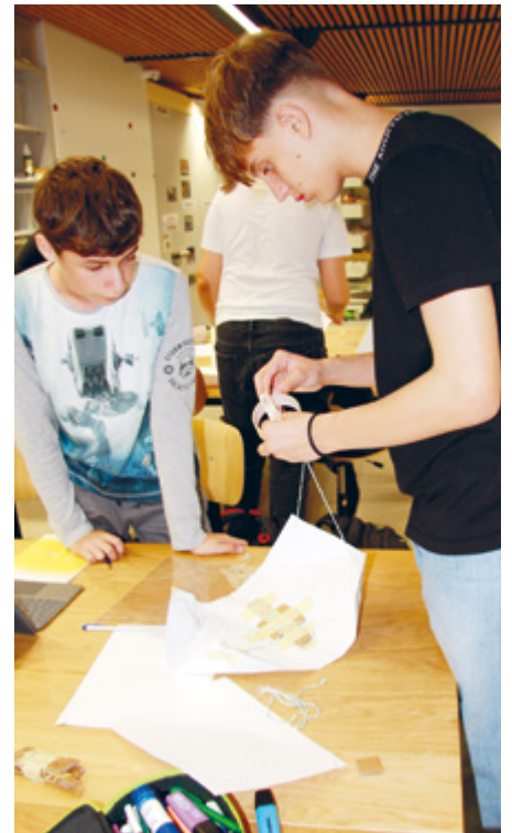
Teamarbeit ist im MakerSpace sehr wichtig.