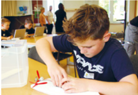
Auch Propeller kommen zum Einsatz.