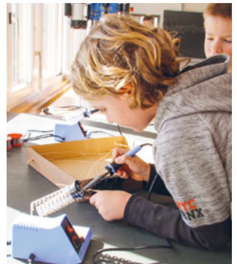
Leon wollte eigentlich eine Heizung herstellen.