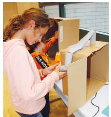
Es gibt auch Einzelprojekte, die später zusammengebaut werden.