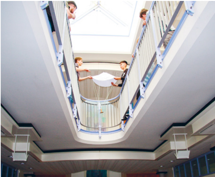
Im Wahlfach MakerSpace probieren die Schüler ihren eigens gebauten Fallschirm aus.