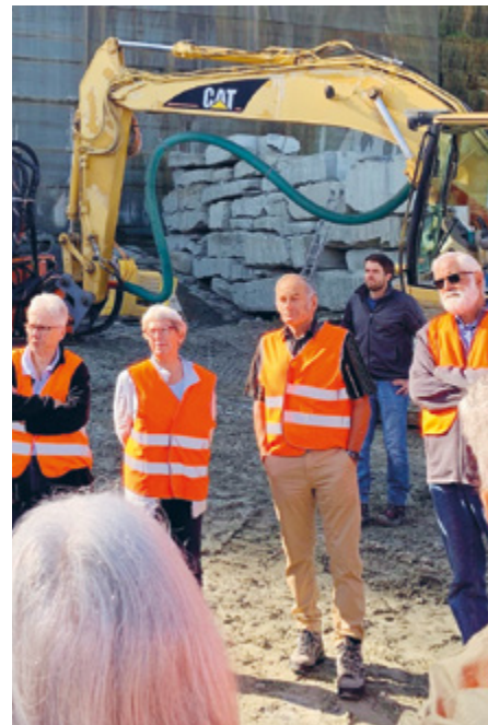
ALVO-Mitglieder besuchen den Steinbruch im Rorschacherberg.