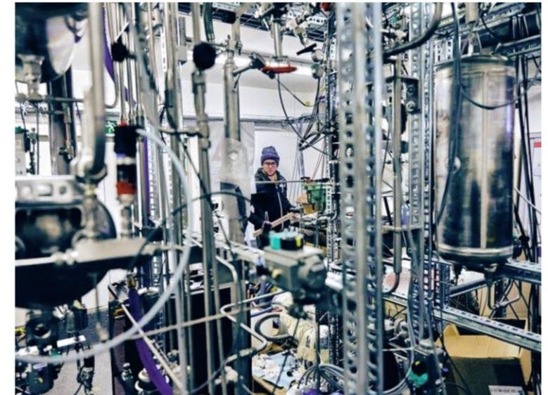
A pilot project at a Swiss university that uses Climeworks equipment to make methane out of airborne CO 2 .

suggest that the earth's capacity for CO 2 sequestration could be in the range of 25 trillion metric tons; burying, say, five billion metric tons of CO 2 a year is therefore within the realm of possibility.